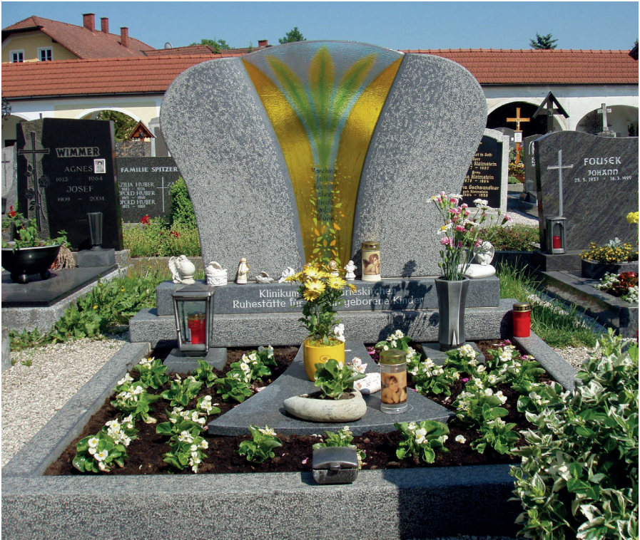
Das Kindergrab am Friedhof St. Sebastian in Grieskirchen